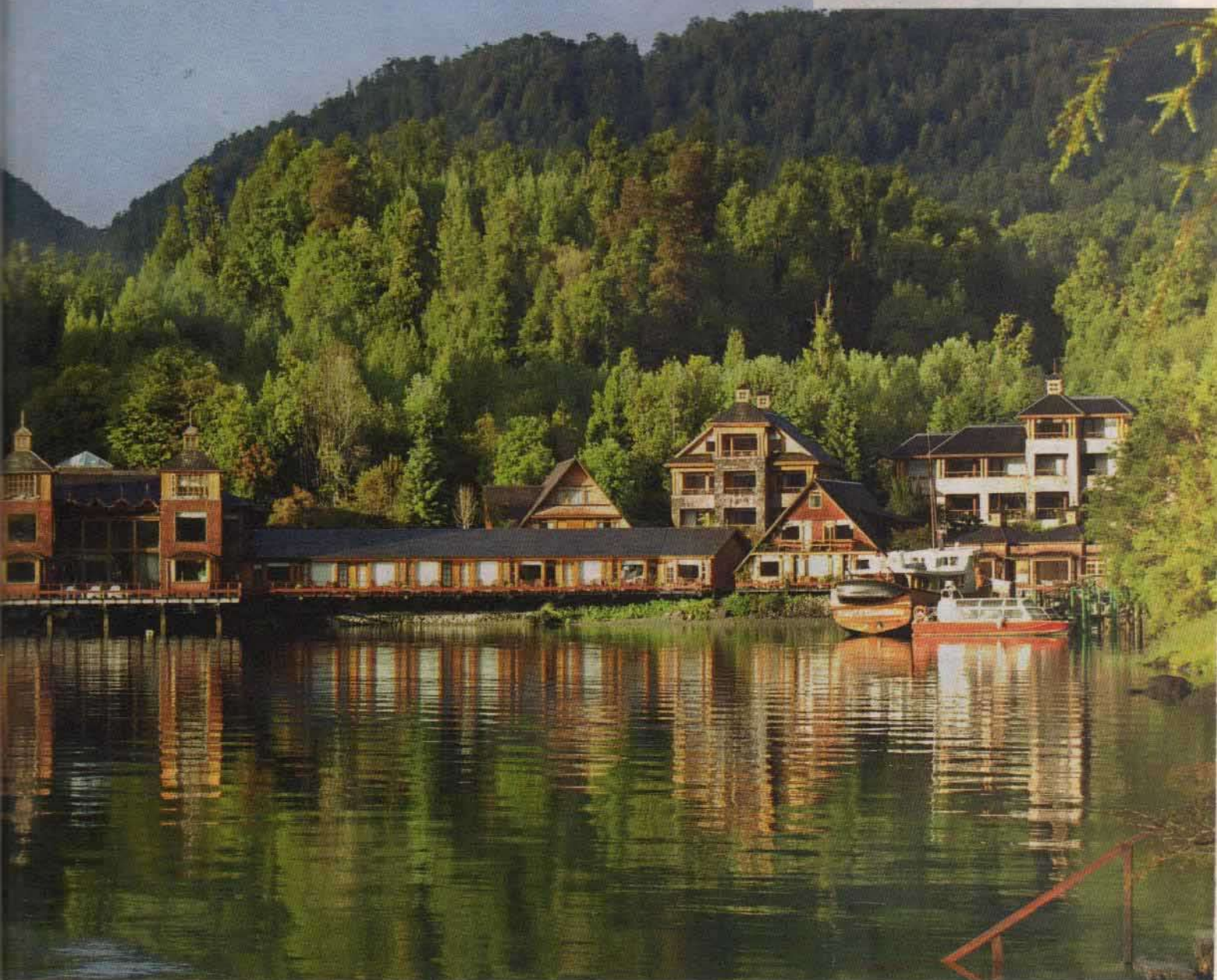
Cascadas en el canal Yacaf y la inconfundible fachada de Termas de Puyubuapi.

Es la opción más nueva que existe para navegar como nómadas del mar entre los canales y dormir como reyes en la Patagonia, en medio de paisajes vírgenes. Parece también un homenaje a Charles Darwin, quien navegó con asombro nuestros mares, y de cuyo nacimiento se conmemoran los 200 años el próximo mes. Al mando de la embarcación se hallan pilotos chilenos de origen inglés, los primos Robin y Martin Westcott, cuyos antepasados vienen navegando desde los tiempos de Nelson y que ya dieron una vuelta al mundo en el Equinoc-