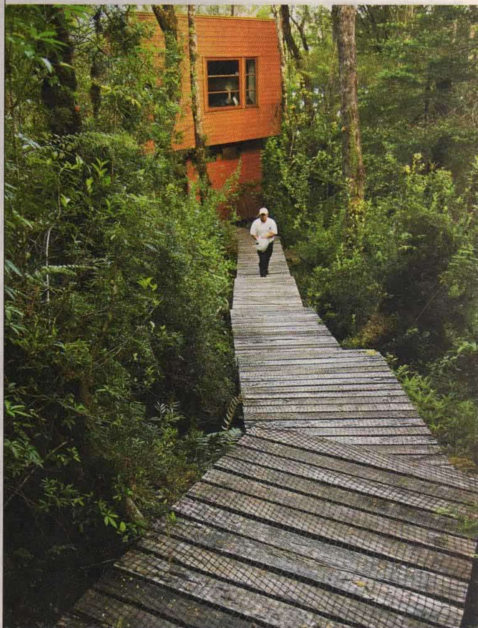
Las pasarelas de Jéchica, insertas en el bosque siempreverde, comunican las tres cómodas cabañas con el refugio.

Nota: Información detallada sobre estos destinos se dará en próximas ediciones.